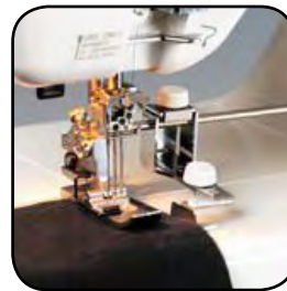
Extra großer Stoffdurchlass